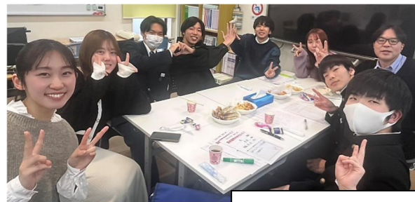
東三条本校での進学祝賀会の様子。写真をたくさん撮りました。