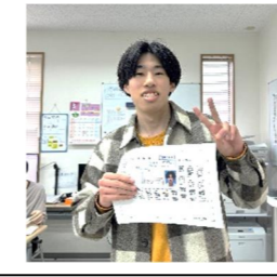
共テE判定からの逆転合格！