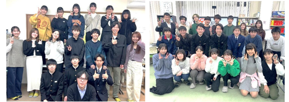
東三条本校での進学祝賀会