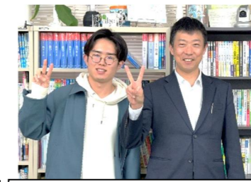
リゼミ初！東大合格おめでとう！